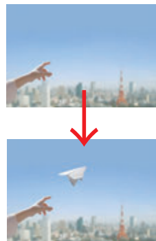
写真の修正や合成