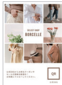
SNSの素材や販促物のデザイン